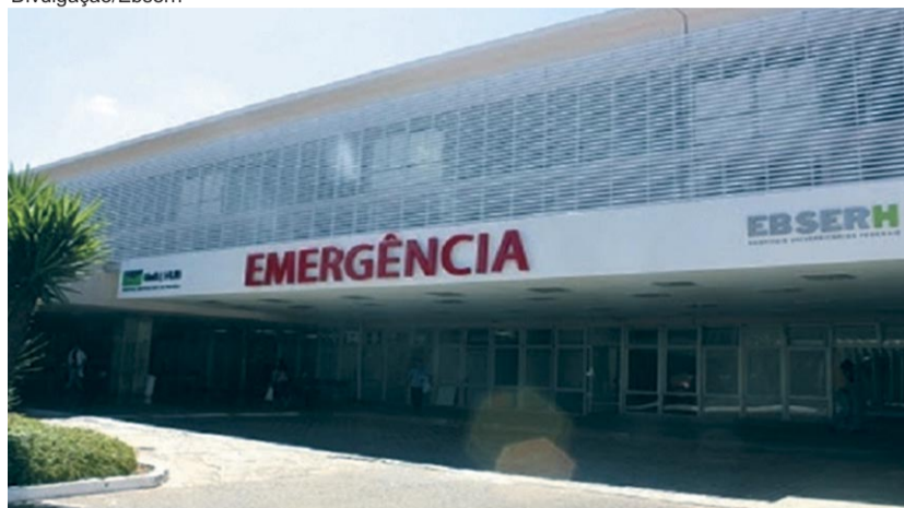
Com a pandemia, o impasse acirrou pois muitos estão na linha de frente

ACT continuem sendo acompanhados de perto pelos empregados. Esse processo é fundamental inclusive no preparo e construção de mobilizações para assegurar que a gestão da Ebserh respeite os direitos dos empregados conquistados com muita luta. Vale ressaltar que a administração da Ebserh segue se negando a dialogar o conjunto das 65 cláusulas apresentadas pela categoria e mantém rejeição a 52.