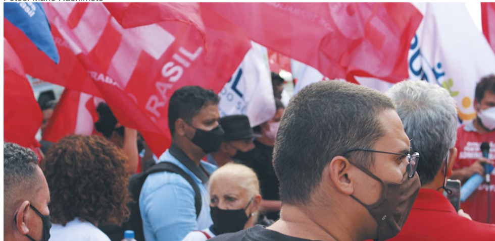
Mobilização intensa, tanto no aeroporto JK quanto no Anexo 2 da Câmara barram PEC

Orçamento secreto - Apesar do governo desembolsar bilhões em emendas parlamentares, muitos visam candidatura própria e o medo de não ser eleito é grande ainda mais que o Supremo Tribunal Federal (STF) validou a decisão da ministra Rosa Weber que suspendeu a execução das chamadas emendas do relator, praticamente