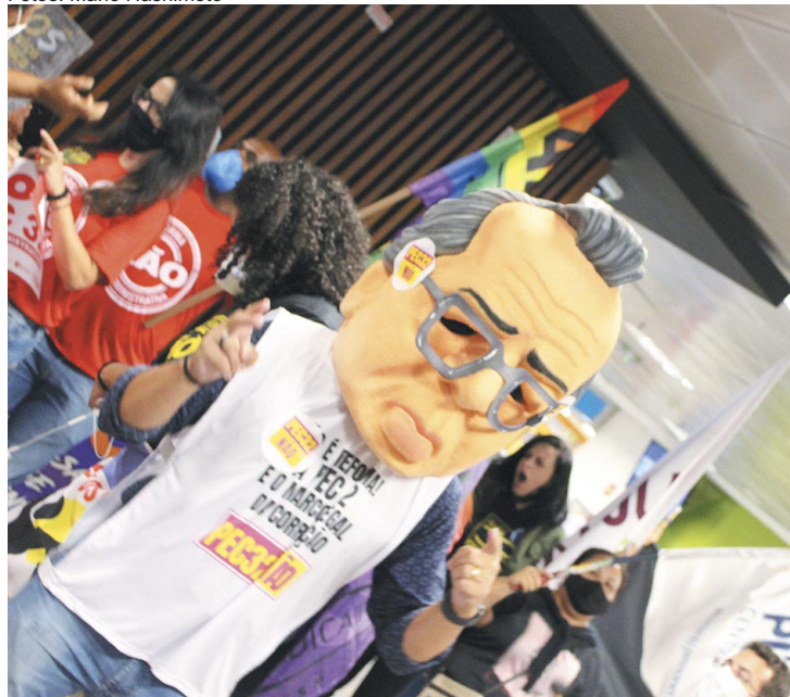
Ministro Paulo Guedes é escrachado como símbolo da corrupção