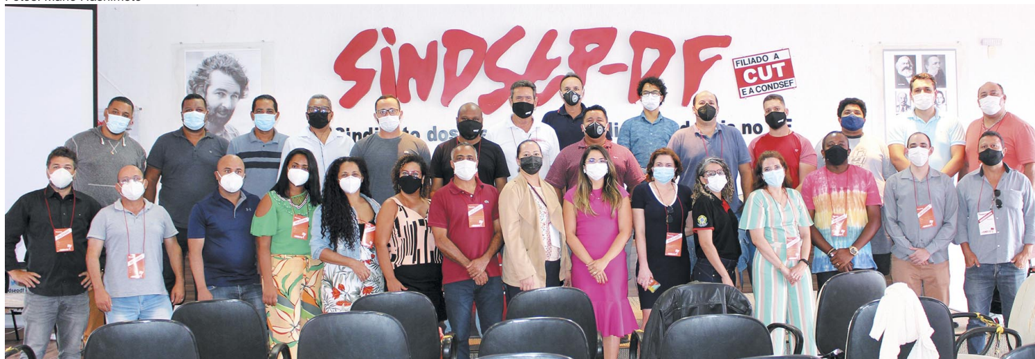
A participação de trabalhadores(as) administrativos foi o diferencial nesta plenária presencial, seguindo protocolos de biossegurança

também realizadas para eleger os representantes que participaram dessa plenária.