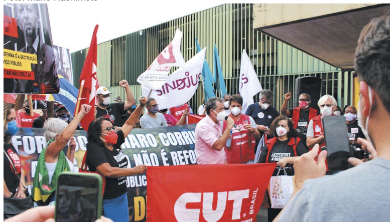
Anexo 2 da Câmara, palco de manifestações e apoio contra a PEC 32

participaram no dia 20, de uma plenária nacional da Condsef/Fenadsef, segunda maior instância deliberativa da entidade. A categoria aprovou um calendário de atividades que inclui um indicativo de greve para 9 de março. Até lá, atividades, manifestações e atos tanto nas ruas quanto nas redes sociais também estão sendo propostas pelos setores que representam 80% dos servidores do Executivo Federal. A Condsef propõe unificar a luta com os servidores estaduais e municipais, que inclusive, atuam juntos na luta contra a PEC 32.