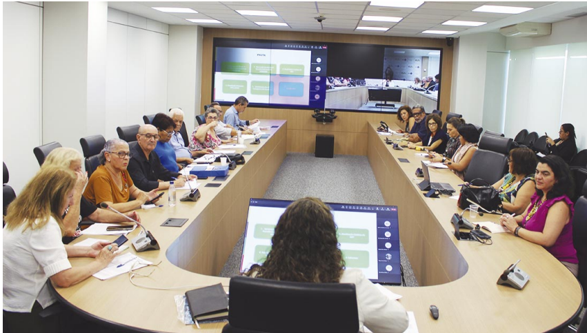
Nova rodada de negociação no MS foi marcada para o dia 28 de novembro