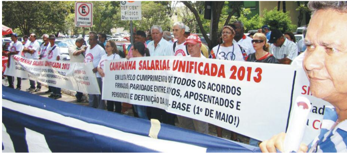
Servidores federais em frente ao bloco K do Ministério do Planejamento: negociação já!

Entre gritos de “Negociação, negociação”, em frente ao bloco K do Ministério do Planejamento, os servidores federais tentaram, no dia 20 de fevereiro, uma audiência com a ministra Miriam Belchior. 31 entidades nacionais que representam o conjunto de servidores do Executivo, Legislativo e Judiciário, participaram da jornada. Mesmo não tendo sido recebidos, o recado foi dado: rodada de negociação já, caso contrário poderá haver paralisação.