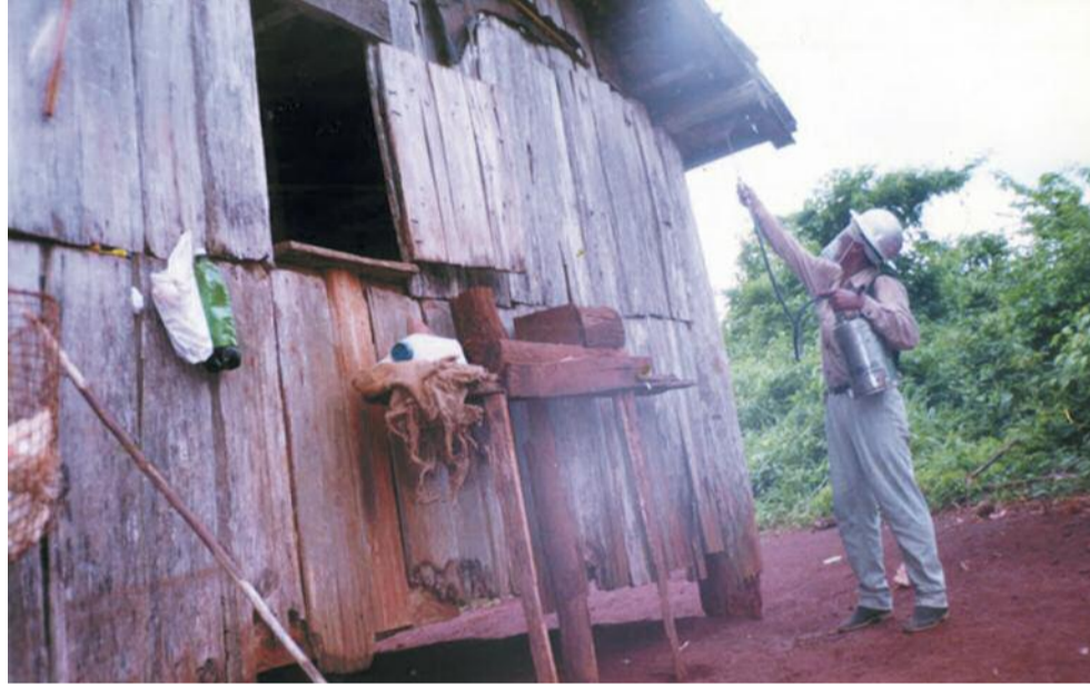
Funcionários da antiga Sucam trabalharam sem nenhuma proteção durante 20 anos

central, provocando vários sintomas podendo levar até a morte.